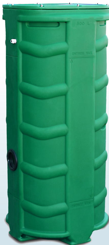
SANIREL 500V KIT DE CONNEXION