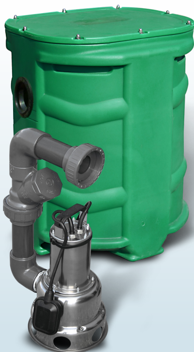
SANIREL 250 KIT DE CONNEXION