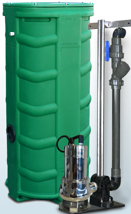
SANIREL 500V 1 POMPE BARRES DE GUIDAGE