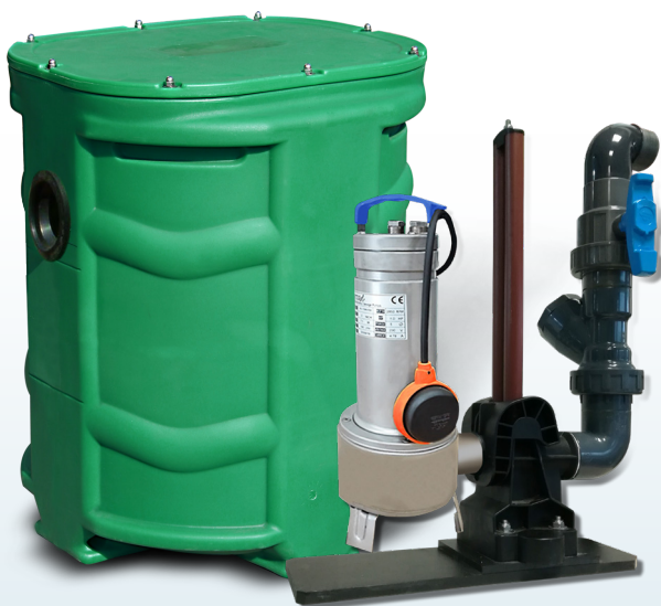
SANIREL 250 1 POMPE BARRES DE GUIDAGE